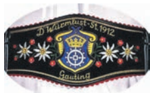
Trachtenverein D'Würmlust-Stamm Gauting

Wir danken ihm für seine 36-jährige Treue und unermüdliche Begeisterung, am Vereinsleben teilzuhaben. Wir werden ihn dafür in lieber Erinnerung behalten.