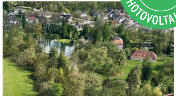
Luftbild: Schloss Fußberg in Gauting mit umliegendem Schlosspark

DER BAU SCHREITET ZÜGIG VORAN: KURZ NACH BAUBEGINN BEREITS 60% VERKAUFT